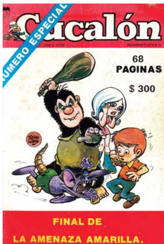
Portada del núm. 23 de la revista xilena Cucalón , 1987, amb Mampato i Ogú en primer terme.

El temps (encara que siga prehistòric) i l'espai se'ns acaben. Espere que hagen gaudit llegint les vicissituds d'aquests cavernícoles de còmic tant com jo descrivint-les. Com han vist, no són molts els que hi ha amb nom propi, però estan per a quedar-se en la història (o prehistòria) dels còmics.