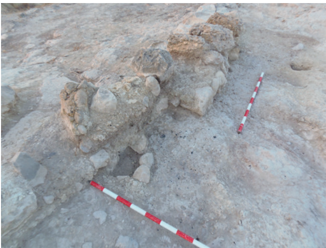
Figura 19.14. Detalle de uno de los calzos de poste del espacio C documentado en 2015.

definido como habitación D, delimitado por el muro occidental de la habitación A y por los restos de otro que se sitúan en dirección E-SE a O-NO. Este espacio estaba muy alterado por la cremación de residuos industriales vertidos en un momento posterior a la excavación de R. Ramos Fernández. No obstante, en su extremo oriental pudo detectarse un nuevo banco corrido y varios suelos de hogares, así como calzos de poste, con abundante material arqueológico, entre el que destacaba una escudilla de madera carbonizada no conservada, varios colgantes de marfil y algunos punzones de hueso en una única fase constructiva. Parte de esta habitación había desaparecido por el desprendimiento de la cresta rocosa en el extremo occidental del espolón. Esta circunstancia, unido a las grietas presentes en esta zona del yacimiento, habría hecho desaparecer parte de otra habitación en el extremo suroccidental del poblado, que no recibió denominación en la posterior publicación realizada.