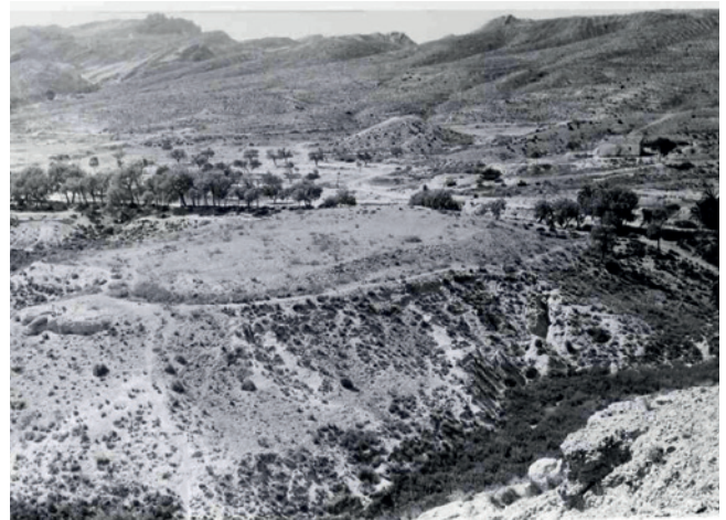
Figura 19.3. Vista del yacimiento calcolítico de Kalathos desde Caramoro I, tomada por Rafael Ramos Fernández en 1981. Fondos del MAHE.