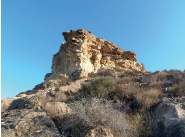
Figura 19.4. Vista desde la ladera oriental del espolón de Caramoro I y sus procesos erosivos.