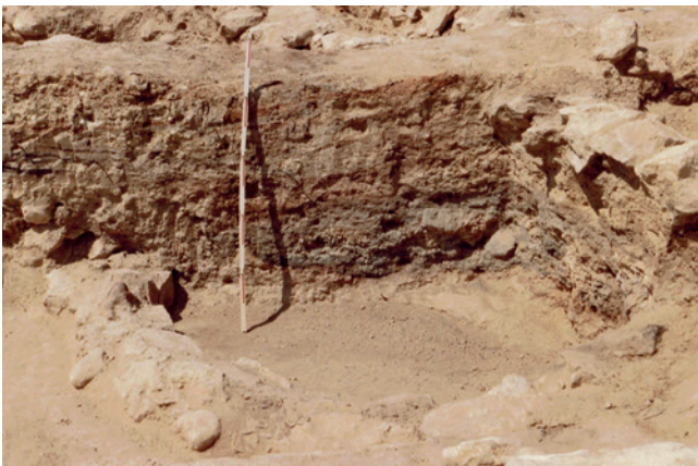
Figura 19.9. Detalle del hogar de la estancia B de R. Ramos.

tigos de 0,50 m de espesor entre sondeos y de 0,25 m entre casillas, donde se repetía la sucesión estratigráfica observada en el sondeo de prospección (fig. 19.8).