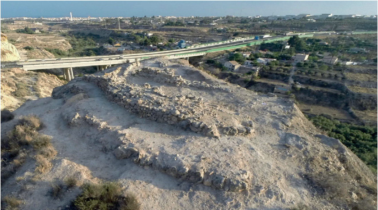
Figura 19.16. Vista general de Caramoro I desde su zona de acceso. Toma realizada en agosto de 2016.

Burdigaliense superior, a los que les siguen otras del Tortoniense y Andaluciense, y que se completan con los conglomerados señalados. En el techo de esta secuencia se suele encontrar caliza biclástica arenosa con fauna marina (Pignatelli, 1973). Entre los factores que influirían a la hora de utilizar un determinado tipo de piedra como material constructivo se encontrarían su dureza y resistencia estructural, su capacidad para resistir la erosión, la facilidad a la hora de extraerla de una cantera, en su caso, y de darle forma, así como su disponibilidad en el entorno, en relación al coste de su transporte (Rapp y Hill, 2006: 214). Así, las rocas sedimentarias como las calizas arenosas y los cantos calizos empleados en Caramoro I son generalmente más fáciles de trabajar respecto a otras rocas, como las metamórficas o ígneas y, por ello, serían utilizadas como materiales de construcción (Morris, 2000: 27). Además, su abundancia y variedad de tamaño en el mismo emplazamiento donde se ubica Caramoro I habrían facilitado enormemente su obtención y puesta en obra.