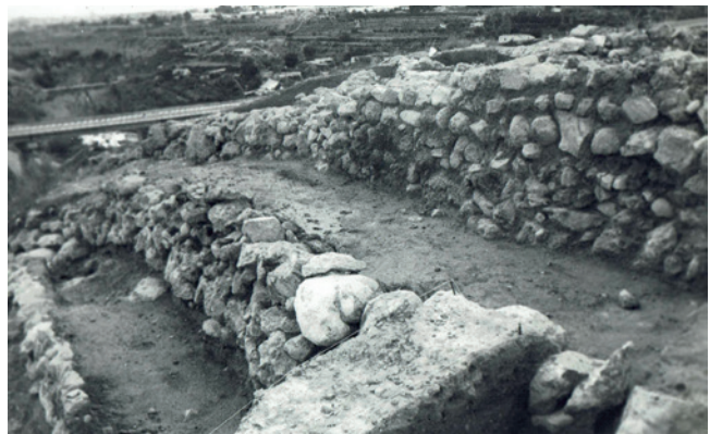
Figura 19.10. Detalle de la plataforma F y G. durante su proceso de excavación.

La habitación A estaba constituida por las estancias A y B de la excavación de R. Ramos Fernández (fig. 19.11). No hay ninguna mención al muro central que dividiría esta habitación A en dos estancias, pudiendo, tal vez, corresponder a una segunda fase constructiva, y que en el momento de la excavación de A. González Prats y E. Ruiz Segura ya habría desaparecido fruto de la erosión y las agresiones antrópicas. En esta vivienda