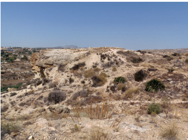
Figura 19.2. Vista del espolón de Caramoro I, en el que se puede observar su altura respecto del curso del río.

de parte del nivel superior de conglomerados (Pignatelli, 1973). El espolón que ocupa Caramoro I presenta una caída en vertical en buena parte de su trayectoria, con excepción de su lado oriental. De este modo, la superficie máxima que delimita el muro de cierre del asentamiento no supera los 500 m 2 , habiendo empleado más de 250 m 2 en su delimitación, con la construcción de diversas estructuras de gran porte, siendo muy destacado el empleo de la piedra. El acceso al asentamiento solamente se podría efectuar por una pequeña zona abierta, situada en su extremo nororiental.