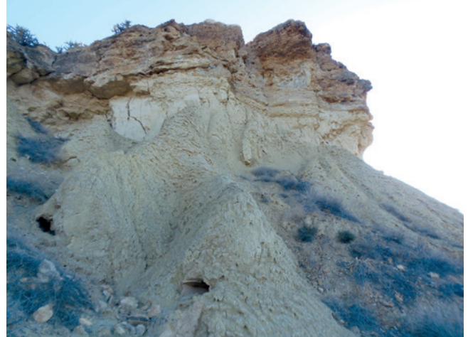
Figura 19.5. Detalle del proceso de erosión en las margas de la base del espolón.