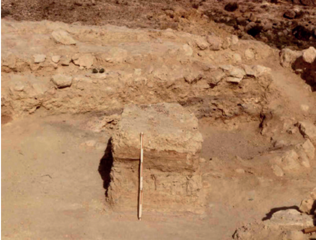
Figura 19.7. Testigo estratigráfico practicado por R. Ramos en el espacio A.