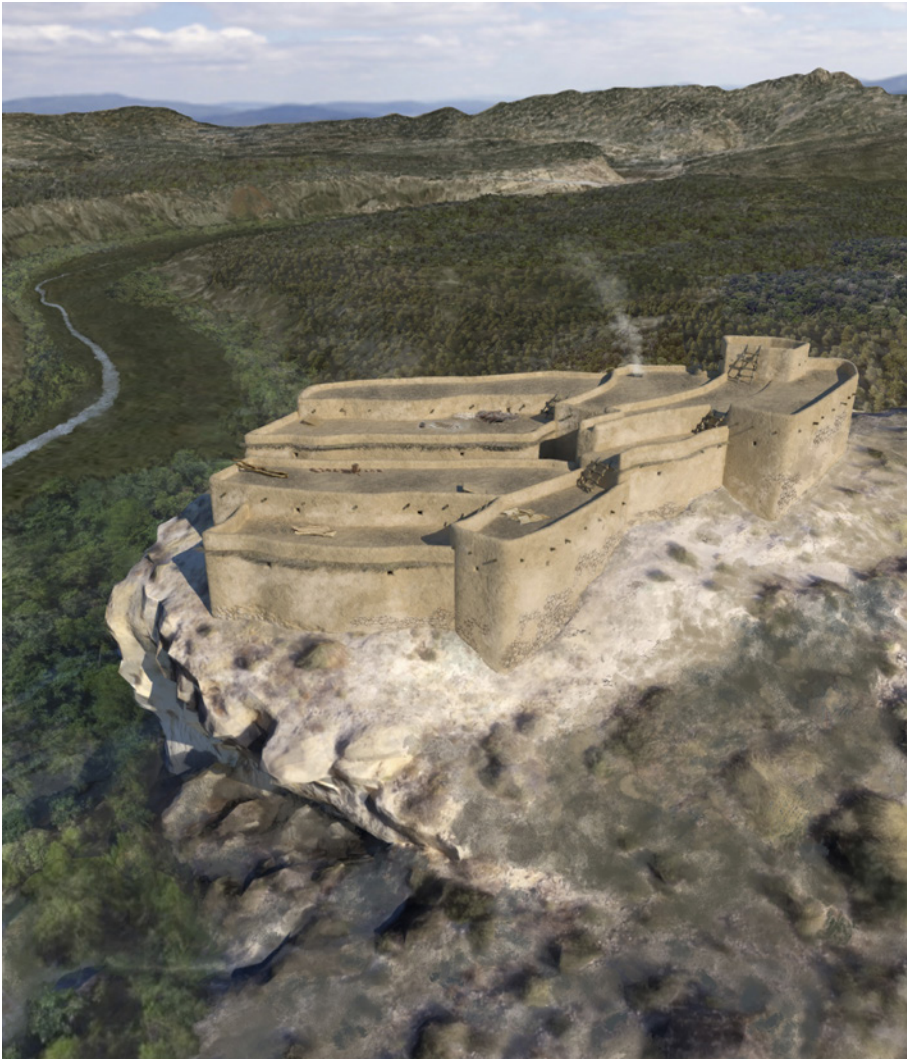
Figura 19.18. Representación infográfica de Caramoro I vista desde el sur. Diseño realizado por José A. Vidal Campello, Juan A. López Padilla y Francisco Javier Jover Maestre.

actividades fundamentales estuvieron orientadas a la producción agropecuaria. Por esta razón, más que calificarlo como torre vigía (Ramos, 1988) o fortín (González Prats y Ruiz, 1995), deberíamos considerarlo como un pequeño asentamiento de carácter agropecuario fortificado o granja fortificada (fig. 19.18).