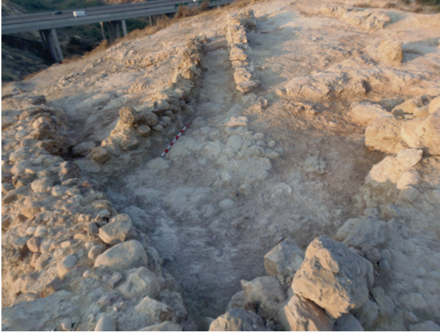
Figura 19.12. Imagen general del “patio” de González y Ruiz o espacio B actual.