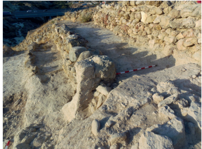
Figura 19.15. Arranque del antemural en su extremo septentrional en el que se puede observar la conservación de parte de su grueso revestimiento.

Durante la campaña realizada en 2015 se pudieron reconocer y definir los espacios A, B, C, D, E, F, G, H, I, J y K, manteniendo las denominaciones de las excavaciones previas. A ellos se incorporaron tres nuevos espacios: el espacio J, situado al O del muro UE 2018, el cual comprende un espacio de tendencia rectangular