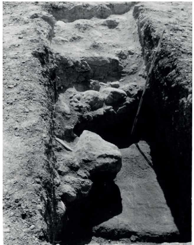
Figura 19.6. Detalle del primer sondeo practicado en 1981 por R. Ramos Fernández.

Siguiendo las notas de R. Ramos Fernández, el yacimiento presentaba, en lo que a registro estratigráfico se refiere, al menos dos niveles de ocupación relacionables con dos pavimentos registrados en el espacio A (figs. 19.6 y 19.7), a su vez amortizados