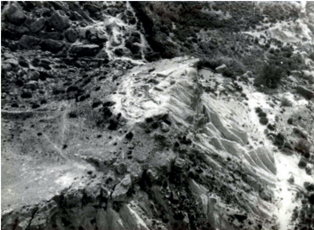
Figura 19.8. Vista aérea del área excavada en 1981. Se puede observar el sistema de cuadrículas establecido por R. Ramos Fernández.