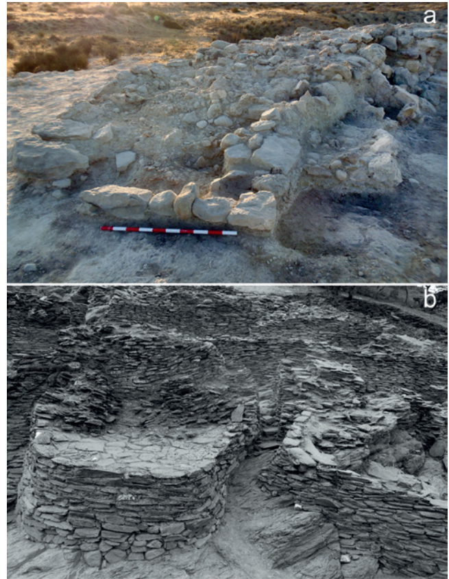
Figura 19.17. Refuerzos constructivos. a. Contrafuerte cuadrangular documentado en el acceso al asentamiento de Caramoro I; b. Contrafuertes (aunque ya restaurados y recrecidos) en Peñalosa (Baños de la Encina, Jaén) (Contreras et al. , 1993).

Por último, merece mencionarse que Caramoro I guarda significativas concomitancias con otros asentamientos bastante alejados, como Piedras Bermejas (Baños de la Encina, Jaén) (Contreras et al. , 1993), localizados en el extremo noroccidental del territorio argárico, en la cuenca del Rumblar. Este emplazamiento, definido como un asentamiento estratégico tipo fortín, es conocido por las actuaciones llevadas a cabo para su documentación planimétrica y topográfica. Se caracteriza por su reducido tamaño –ocupando una superficie de 750 m 2 –, la existencia de un recinto de planta piriforme con unas dimensiones máximas de 32 m de longitud por 22 m de anchura, y la presencia de potentes muros con un grosor que oscila entre 1,60 y 2 m. En él se distinguen dos espacios diferentes, una torre de tendencia circular en el ángulo sureste para reforzar la entrada –similar a las docu-