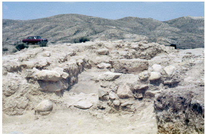
Figura 19.11. Extremo meridional del espacio A. Vano de acceso.

A, un potente muro oriental, de 4 m de anchura, se prolongaba hacia el extremo meridional, decreciendo en amplitud hasta alcanzar una anchura aproximada de 1 m. Bajo el banco corrido documentado por R. Ramos Fernández en el extremo oriental de su estancia B, aparecía otro banco corrido y un hoyo de poste correspondiente a la fase constructiva más antigua del poblado, y que habría que considerar como infrapuestos con el supuesto hogar registrado en la excavación realizada en 1981. Asimismo, esta habitación también presentaba un banco corrido en su extremo occidental.