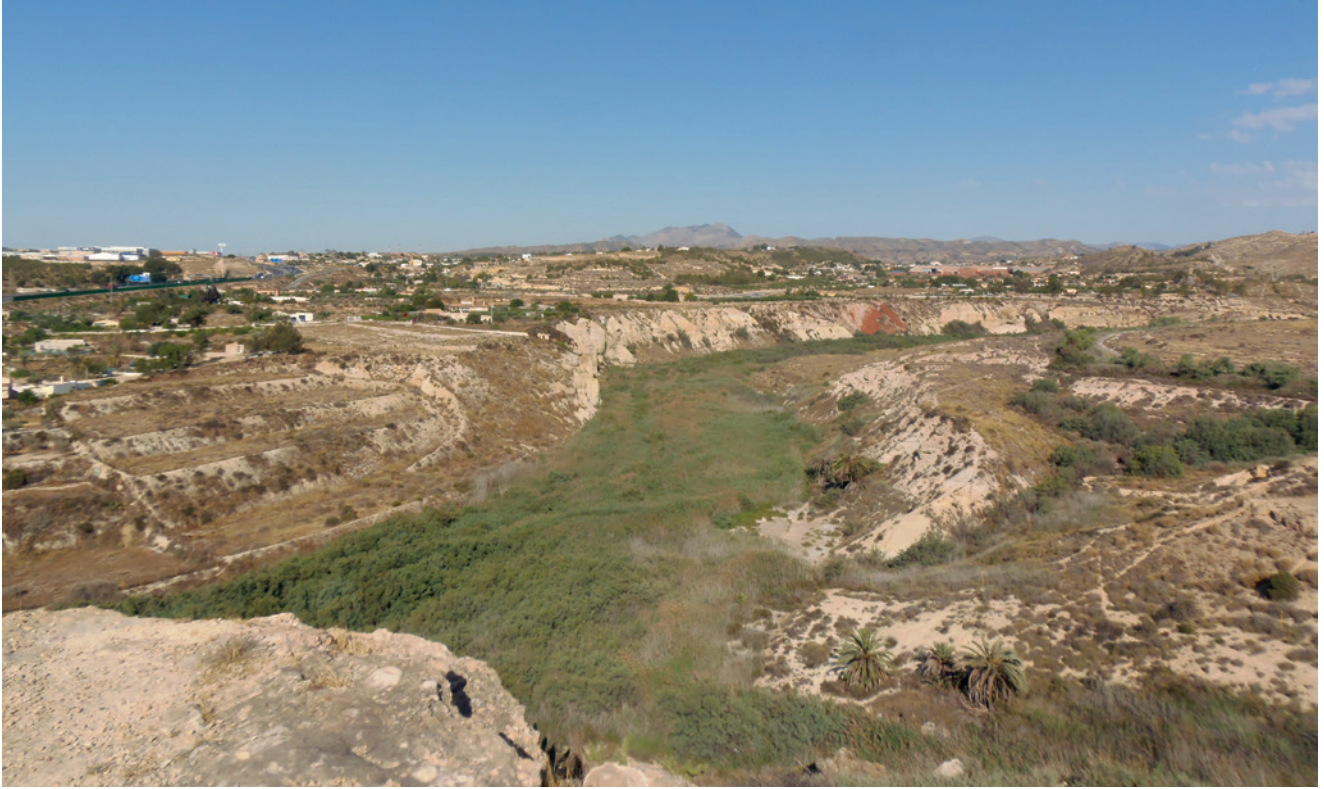
Figura 19.1. Vista del curso del río Vinalopó desde Caramoro I.

Caramoro I está directamente edificado sobre un conjunto estratificado de materiales pliocenos, básicamente calizas y conglomerados. El agua, debido a su alta porosidad y permeabilidad, se filtra con suma rapidez. Debajo de tales conglomerados aparece un nivel de margas arcillosas triásicas de coloración ocre-blanquecina y verdosa a medida a que se humedece. Geomorfológicamente estos dos niveles dan un relieve típico de murallones con bruscas pendientes (figs. 19.4 y 19.5), debido a que la erosión se realiza en las margas infrayacentes, lo que produce una caída por gravedad