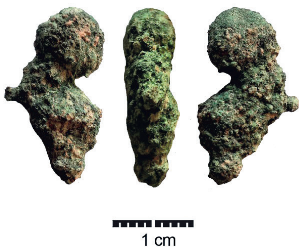
Figura 14.2. Bola de cobre recuperada del relleno del contrafuerte 2102.

El restante ejemplar se encuentra fragmentado y no presenta ningún ápice, lo que dificulta definir su morfología, siendo su sección transversal cuadrangular. Sus dimensiones son: 19 mm de longitud, 4 mm de anchura y 3 mm de espesor máximo. En relación a su contexto de hallazgo, procede del espacio E. Este objeto fue publicado previamente como un fragmento de escoplo de sección cuadrada (Simón, 1998: 55), aunque tras haberlo observado detenidamente durante nuestro trabajo resulta difícil determinar si se trata de un fragmento de escoplo o de punzón. En este sentido, un objeto similar al que aquí hemos estudiado ha sido publicado recientemente como un fragmento de punzón de sección transversal cuadrangular (Soriano, 2014: 223, fig.3.2).