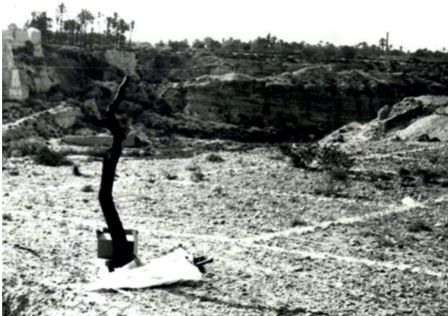
Figura 5.3. Promontori preparado para iniciar la excavación, [1979]. Museo Arqueológico y de Historia de Elche “Alejandro Ramos Folqués”-MAHE.