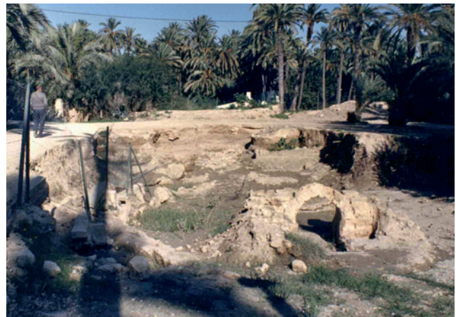
Figura 5.2. El yacimiento del Parque Infantil de Tráfico antes de su cubrimiento. Museo Arqueológico y de Historia de Elche "Alejandro Ramos Folqués"-MAHE.

El 17 de octubre de 1983, Ramos iniciaría la segunda campaña de excavaciones en el Parque Infantil de Tráfico (Parque Municipal), tras la realizada con su padre en 1972. Esta segunda campaña se produciría, según la solicitud de autorización de excavación que dirige al Ministerio en enero de 1983, con motivo de un proyecto de remodelación de los jardines que iba a afectar a las estructuras sacadas a la luz en la anterior intervención y a los materiales subyacentes. 13 Posteriormente, en 1984, 1985 y 1986, se autorizaría la realización de nuevas campañas 14 (fig. 5.2).