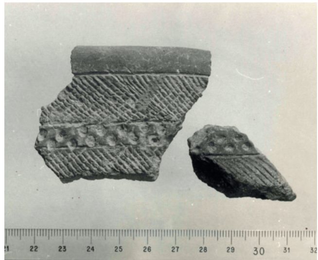
Figura 5.5. El archivo fotográfico del MAHE conserva un buen número de fotografías, coetáneas a la intervención, de las piezas de Promontori. Museo Arqueológico y de Historia de Elche “Alejandro Ramos Folqués”-MAHE.