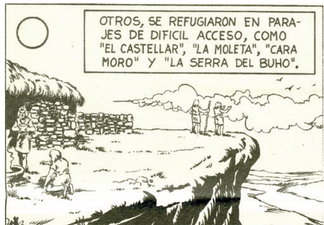
Figura 5.11. El espalón de Caramoro según el cómic “Historia de Elche” publicada en fascículos por el periódico Baix Vinalopó en mayo de 1985. Guión y dibujos: Juan José Tarí Agulló. Asesoramiento: Rafael Ramos Fernández.

locales”. Por fin, en 1984, presentaría un trabajo sobre las formas y los motivos decorativos de los vasos hallados en Elche en un coloquio celebrado en Alcoi, el 1 y el 2 de diciembre, sobre el Eneolítico en el País Valenciano.