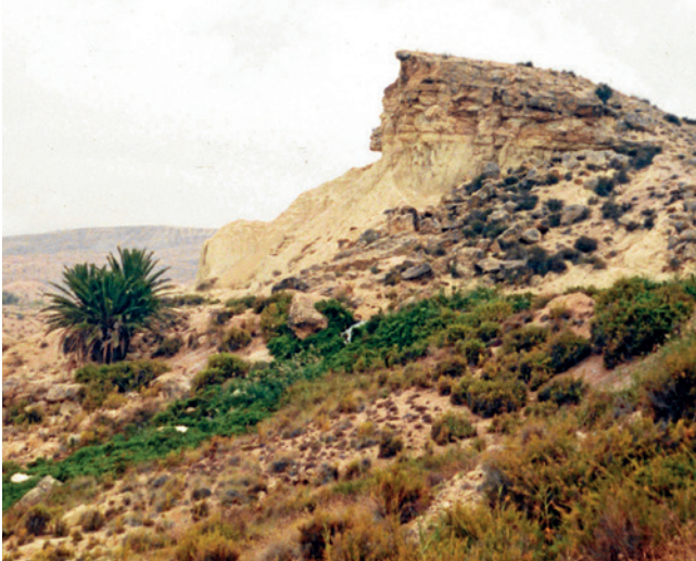
Figura 5.6. El espolón de Caramoro fotografiado por Rafael Ramos. Museo Arqueológico y de Historia de Elche “Alejandro Ramos Folqués”-MAHE.

exponía sobre cómo proceder a una prospección podían ser o no correctas. 31 De este modo, en uno de sus recorridos por el campo de Elche, se propuso comprobar la “existencia de poblados de la Edad del Bronce diseminados por puntos de fácil defensa en el territorio ilicitano”. A esta tesis se añadió la hipótesis de la más que probable relación entre los mismos, ya que todos los materiales encontrados hasta ese momento indicaban “una misma comunidad” que habitaba diversos lugares próximos entre sí (Ramos Fernández, 1988a: 93).