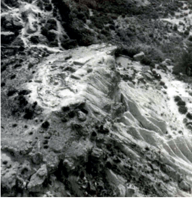
Figura 5.7. Foto aérea del yacimiento durante la excavación de 1981. Museo Arqueológico y de Historia de Elche “Alejandro Ramos Folqués”-MAHE.

tamiento excavado por Ramos, fruto de las persistentes visitas de clandestinos”. Además, a todo esto se añadía “la utilización del lugar como vertedero de residuos textiles y de retales de la fabricación de calzado”. Posteriormente, en junio de 1993, los mismos arqueólogos efectuaron la planimetría del enclave (González Prats y Ruiz, 1995: 86).