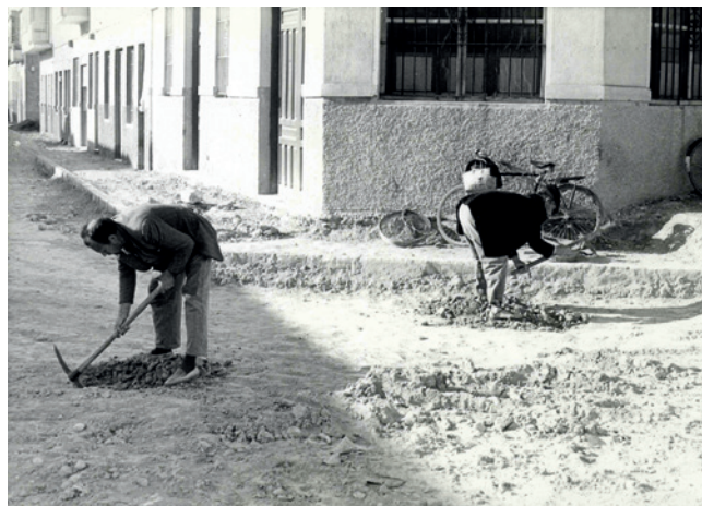
Figura 5.1. Excavación en 1965 en el yacimiento de la Figuera Redona (calle Blas Valero). Museo Arqueológico y de Historia de Elche “Alejandro Ramos Folqués”-MAHE.

Unos años antes, en 1965, Alejandro Ramos había realizado una intervención en el yacimiento eneolítico de la Figuera Redona, un asentamiento, descubierto por Pedro Ibarra en 1900, situado en llano a la derecha del río, y actualmente absorbido por la población. Como cuenta el mismo Ramos Folqués, en 1940 había realizado un primer rastreo al norte de la vía del ferrocarril, encontrando tres fondos de cabaña que contenían únicamente algunos fragmentos cerámicos, frente a la abundancia de materiales en superficie (Ramos Folqués, 1953: 349). La actuación de 1965 se produjo a raíz de la comunicación de la aparición de unas manchas oscuras, observadas por un vecino de la calle Blas Valero al realizarse obras de desmonte de tierras en dicha calle para proceder a su asfaltado. Tras acceder el concejal de obras de la época –y el contratista– a la paralización de las actuaciones (Ramos Folqués, 1989: 14), se pudieron iniciar los trabajos de excavación en el tramo situado al final de la vía citada, junto a la avenida del Ferrocarril, ayudado Ramos Folqués, como se ve en las fotogra-