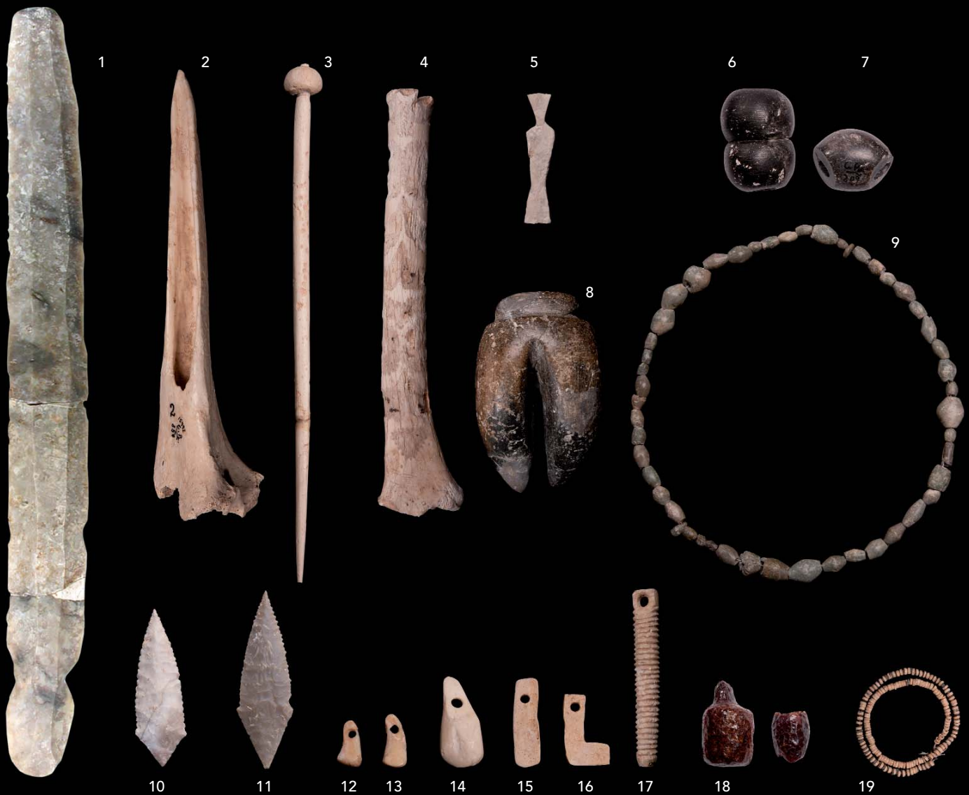
Figura 2. Selecció d'objectes associats als soterraments del neolític final/eneolític de Pastora: d'esquerra a dreta i de dalt a baix. 1, gran fulla ganivet de sílex (mesures: 22 x 26 x 5,5 mm); 2, punxó d'os; 3, agulla de cap esferoïdal mòbil; 4, ídol oculat sobre os; 5, ídol pla sobre os; 6, dena geminada amb perforació bicònica; 7, dena en oliva de forma pseudoval amb perforació bicònica; 8, ídol antropomorf sobre pedra negra; 9, grans de pedra verda; 10 i 11, puntes de fletxa de forma romboidal; 12, 13 i 14, penjolls sobre ullals de cérvol; 15, penjoll recte sobre os; 16, penjoll en "L"; 17, penjoll acanalat; 18, penjoll cilíndric amb apèndix no perforat sobre ambre; 19, denes discoïdals, sobre lignit i calcària.

campanyes escameses durant els anys 1945 i 1950. En realitat, l'àrea excavada per Pascual –meitat septentrional– va resultar la més fèrtil, en tant que l'excavació d'Alcácer en la zona meridional i de l'entrada va suposar la ràpida detecció d'una crosta estalagmítica que ocupava, amb pronunciat pendent, bona part de la meitat meridional. El diari refereix un total de 6 cranis que segueixen la numeració dels discriminats en el seu dia per Pascual.