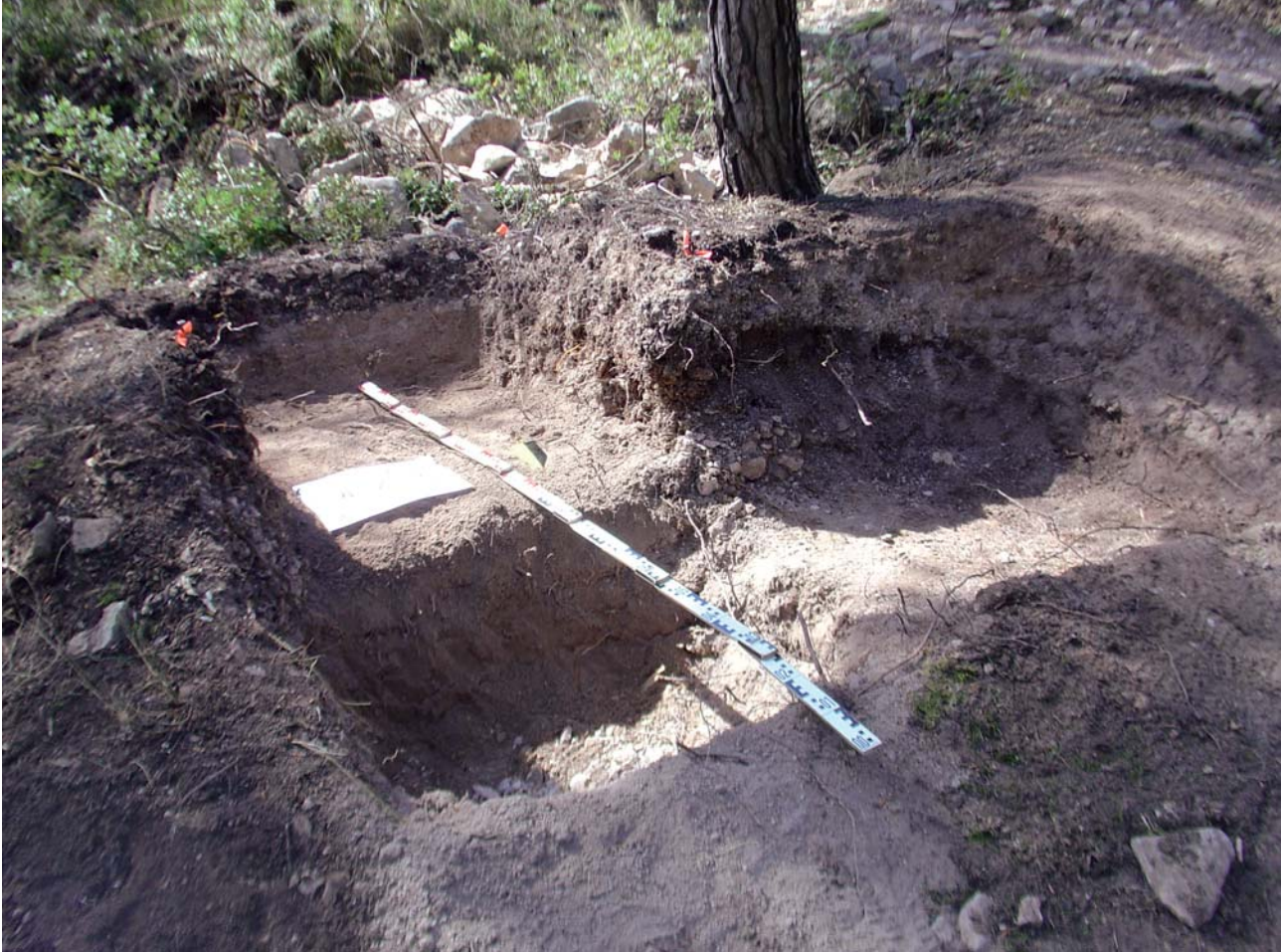
Figura 3. Excavació de la terrera en l'àrea exterior del jaciment.

Després de finalitzar els treballs de camp, la investigació es troba en fase d'avaluació de dades. Disposem ja dels resultats de la datació AMS de 10 mostres tretes de fragments de mandíbules humanes. Aquestes datacions emmarquen l'ús funerari de la cavitat durant el neolític final (des de finals del VI mil·lenni cal BP) l'horitzó campaniforme (finals del V mil·lenni cal BP), i el bronze mitjà (primer terç del IV mil·lenni cal BP). També estem en disposició d'avançar algunes claus per a la seua interpretació contextual i diacrònica. Entre elles assenyalarem, en primer lloc, la referida al grau de selecció dels materials depositats en el SIP. Servisca d'exemple la presència quasi exclusiva de restes cranials en els fons del museu, factor que impedia fer valoracions relacionades amb altres aspectes anatòmics o patològics sobre les restes postcranials i per