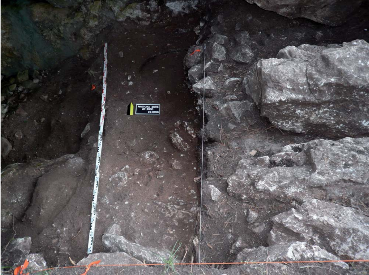
Figura 4. Sondeig efectuat a l'entrada de la cavitat.

objectes materials significatius (adorns, objectes ossis, ídols, una selecció de fragments ceràmics, peces metàl·liques entre altres). Encara així, el mostratge efectuat ha propiciat un increment notable en la xifra d'objectes materials, sobretot pel que fa als adorns menuts.