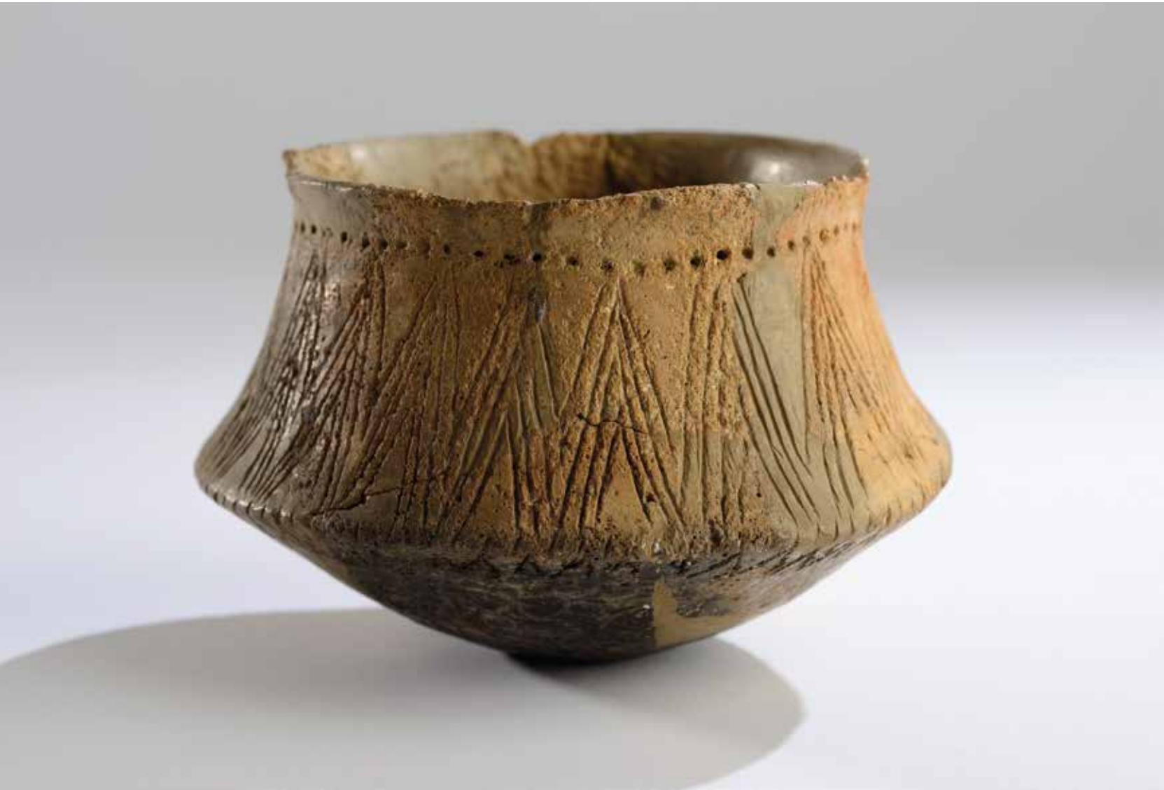
Vas carenat amb decoració incisa en ziga-zaga.