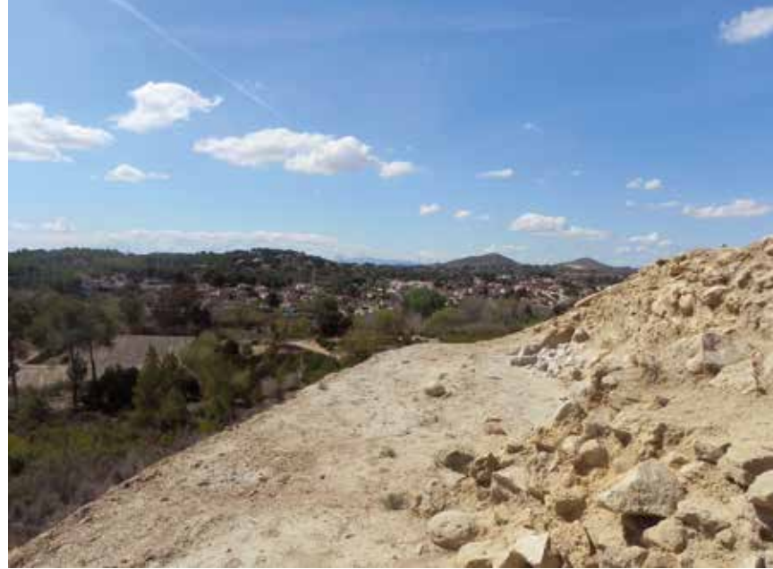
Al fons de la imatge, vista del jaciment dels Carassols, a l'altre costat del riu Túria.

Quant a la Lloma de Betxí, jaciment del bronze ple i culturalment adscrit al bronze valencià, passarem a analitzar el territori on a priori situem el seu espai social,