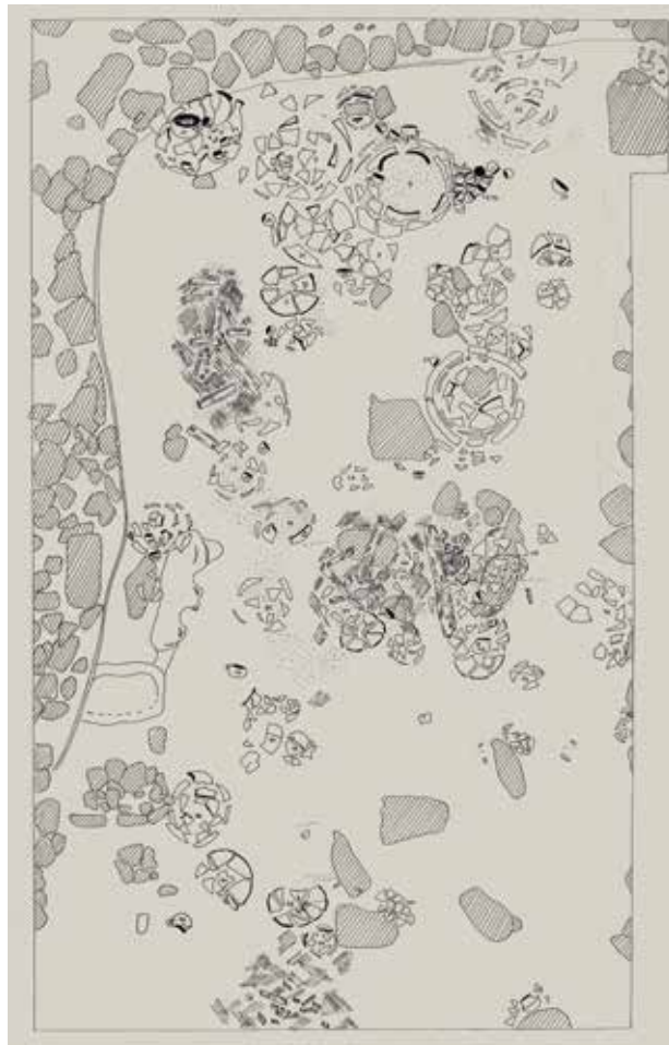
Fig. 2. Planta de la primera campanya d'excavació, 1984, amb la dispersió de les troballes. Dibuix d'Helena Bonet.

les datacions absolutes de ^{14}\text{C} que els estudis posteriors han aportat. Però l'interés de la Lloma no es limita a l'excelsionitat dels efectes, la majoria d'ells complets, sinó també a la conservació de les seues estructures constructives. Les altes parets de les habitacions, fetes de pedres i fang, conserven el seu enlluït, i limitades per elles podem observar la doble filera de les bases de pedra sobre les quals s'alçaven els pals de fusta, i també les mateixes restes carbonitzades dels pals i de la sostrada, que ens permeten reconstruir l'estructura de la coberta vegetal. En l'interior de les habitacions, cubetes i suports per a atuells, construïts en fang, ens parlen dels equipaments domèstics, dels telers que suportaven els contrapesos de fang que allí es troben, de la mòlta del gra en els molins de vaivé: són l'empremta de les activitats pròpies de la vida quotidiana d'aquella comunitat, que mai fins llavors no se'ns havien revelat amb tanta intensitat. Recorde no do-